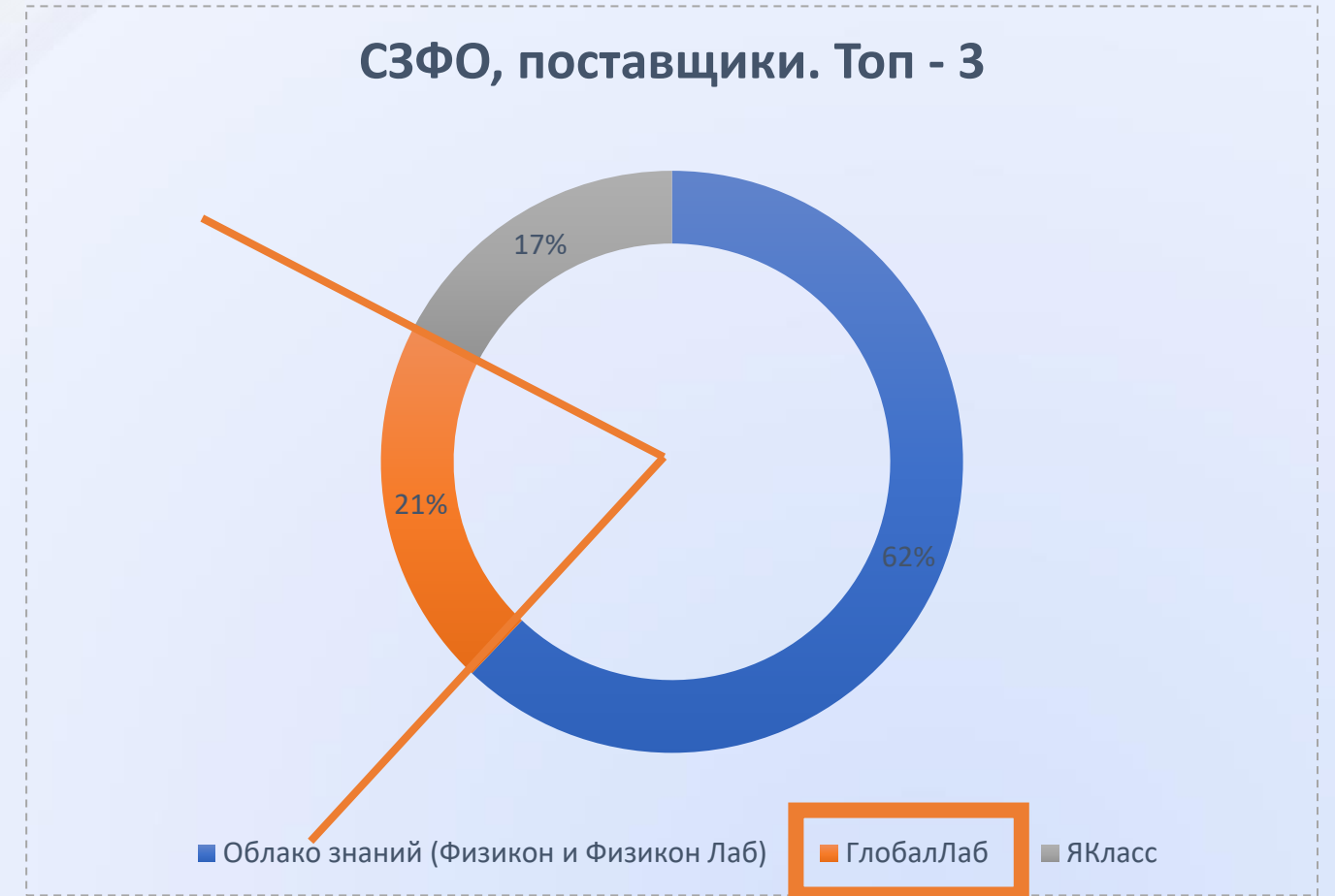
СЗФО, поставщики. Топ - 3